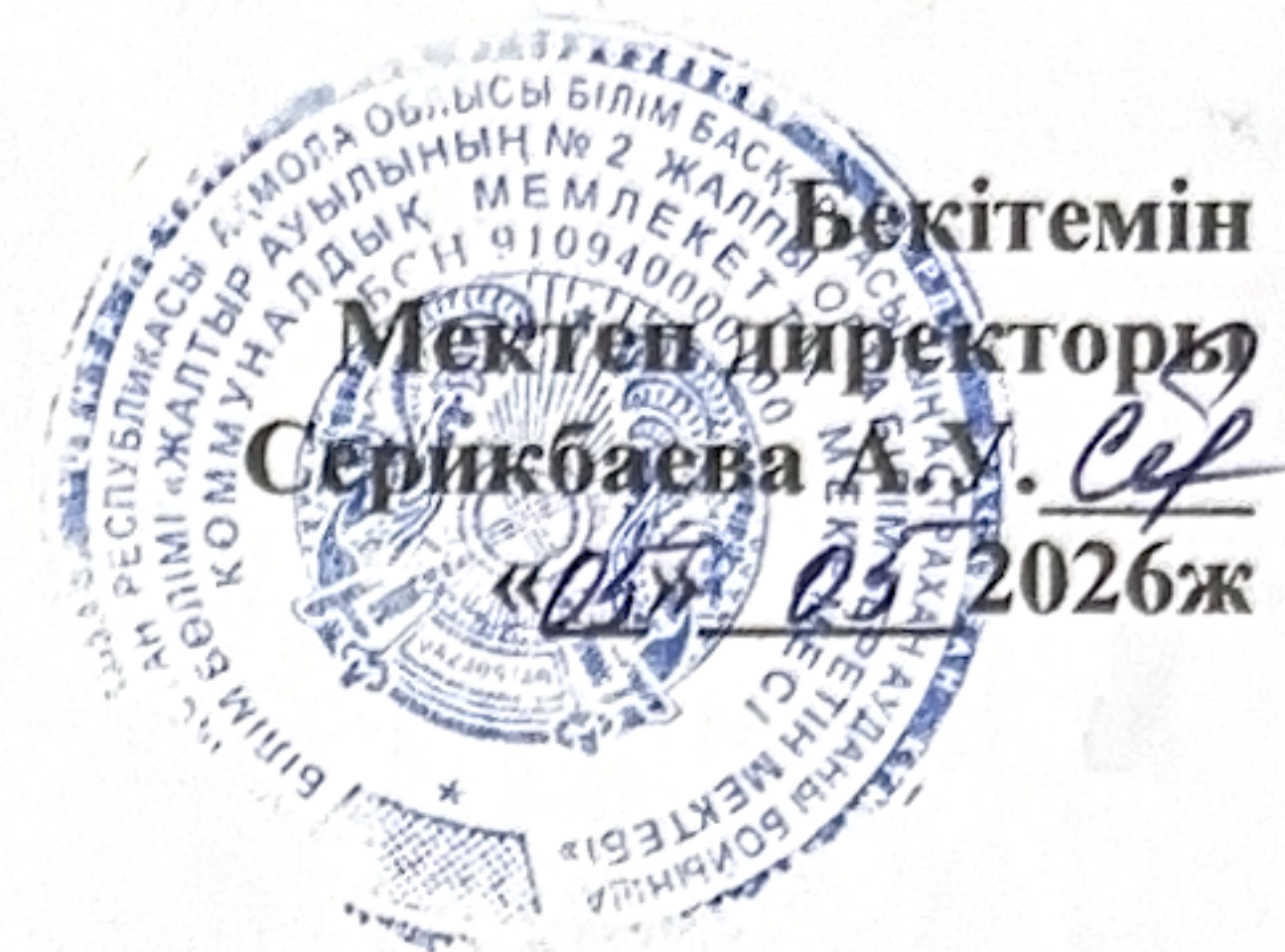
График посещения уроков администрацией школы (директор, заместители директора по УР) на май 2025-2026 учебного года по КГУ «ООШ №2 села Жалтыр»