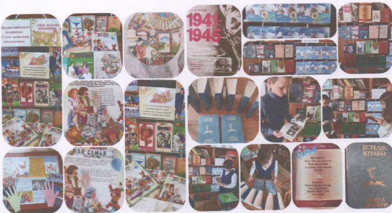
Справка о проведенных мероприятиях за июнь 2022года.

Для учащихся школы в школьной библиотеке организована книжная выставка. Предложены книги для летнего чтения.